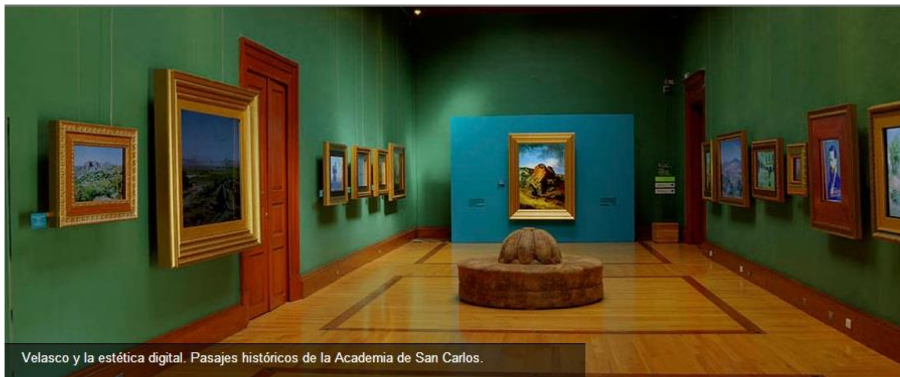
Velasco y la estética digital. Pasajes históricos de la Academia de San Carlos.